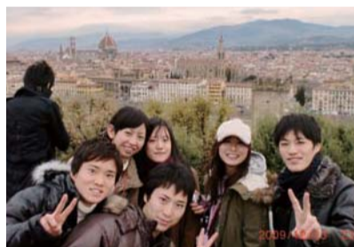
フィレンツェの街なみ