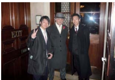
レインズボロ (ホテル)

例年のヨーロッパ研修では、イタリア(ミラノ・フィレンツェ・ローマ)⇒イギリス(ロンドン)⇒フランス(パリ)の3カ国5都市を周る旅行でしたが、今回の悪天候による飛行機欠航で、ロンドンからパリへの移動が不可能となりました。研修旅行始まって以来初めての大きなハプニングで、2カ国4都市に変更されました。学生たちは、気持ちを切り替え、2週間の研修旅行でヨーロッパの伝統・文化を学ぶとともに学生最後の研修旅行を満喫しました。