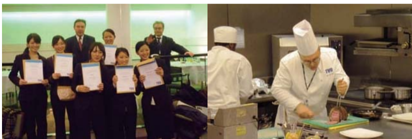
テムズバレー大学 1日体験入学