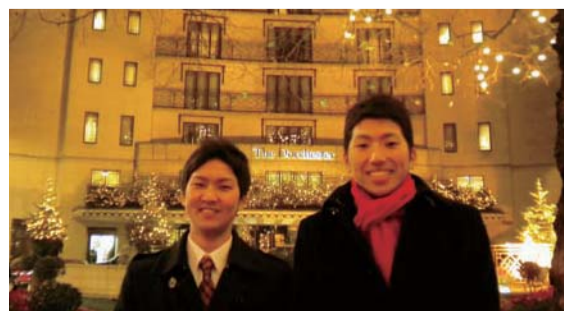
ザ・ドーチェスター ホテルの前

した。イギリスの有名なホテルのホテルエグゼクティブの働きを間近に観ることができ、サービスに対する意識を高めることにつながりました。観光を楽しみ、ホテルの知識を学んだヨーロッパ研修は、人生の財産となりました。